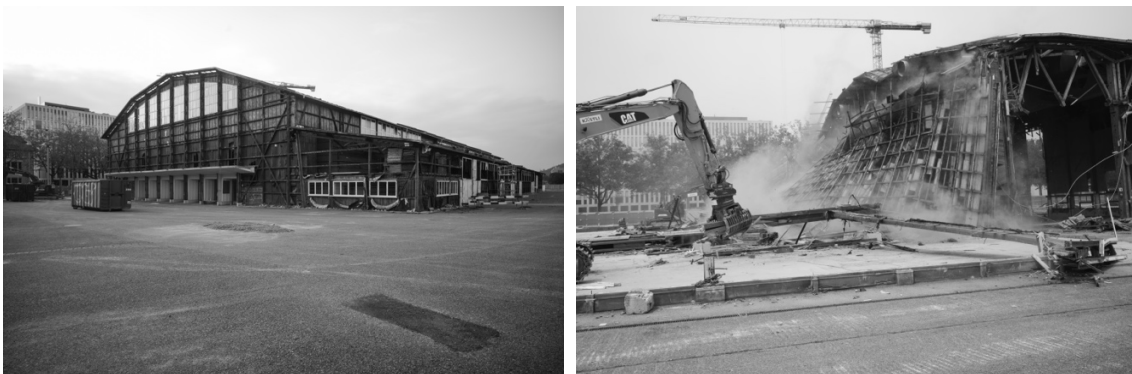
Ein architektonisches Berner Monument verschwindet. Fotografien sind in der Burgerbibliothek Bern archiviert.