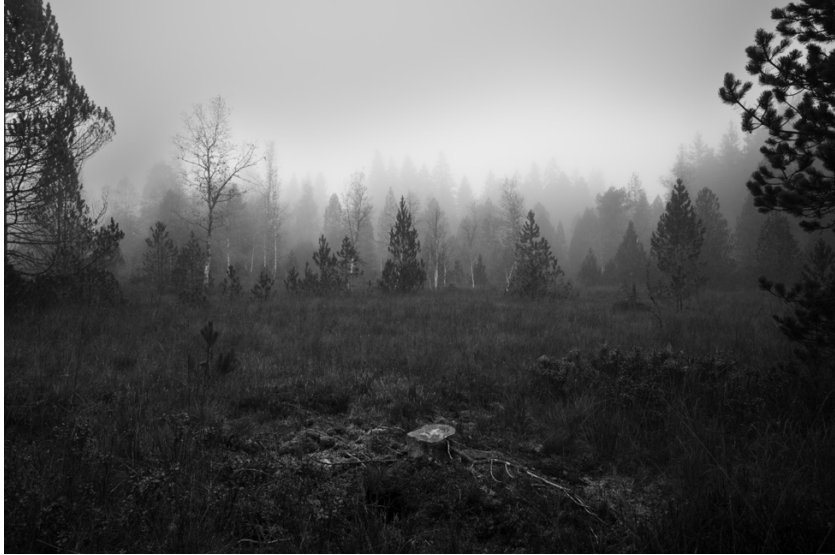
Ein Hochmoor im Innereriz im Nebel - mystisch