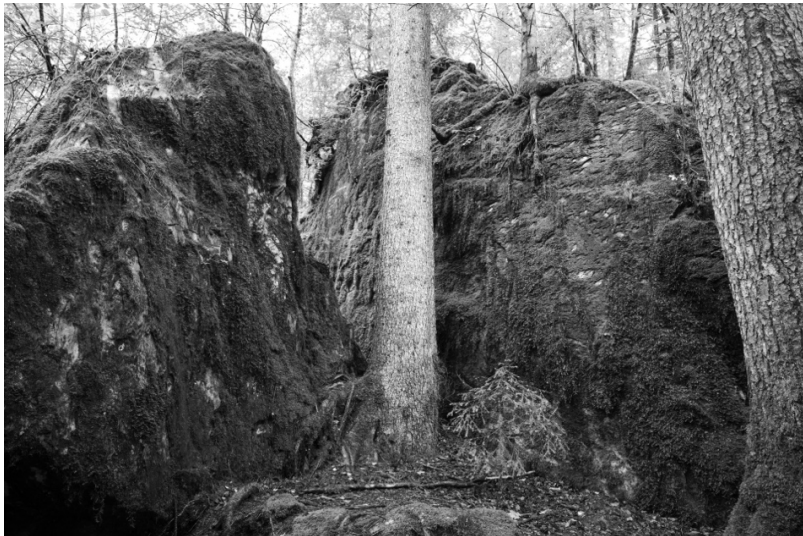
An der Grimsel und am Blausee. Von aussen gewöhnliche Fichtenwälder, innen skurrile Felsen und Fichten gemeinsam wie extra drapiert.