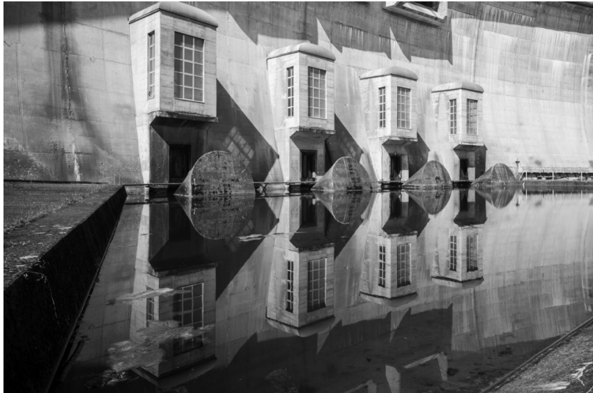
Ein historisches, gut versecktes Wasserkraftwerk unterhalb der Schiffenen-Staumauer. Hat etwas Surreales und Märchenhaftes.