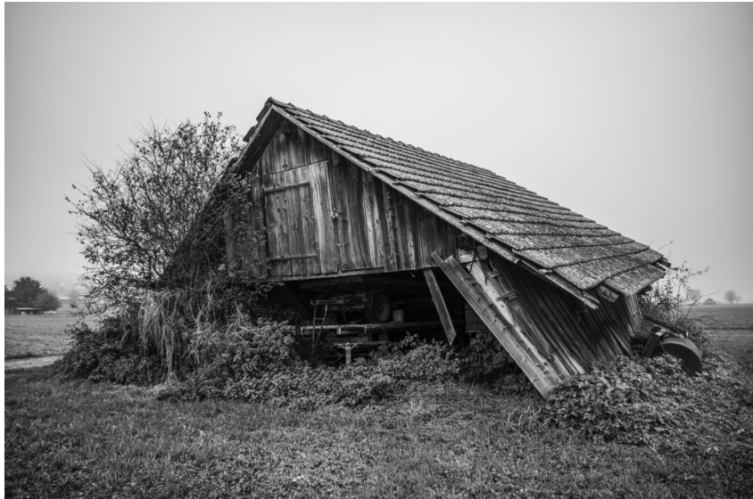
Landwirtschaftlich genutzte kleine Holz- und Steinhäuschen in Gantrisch , Gürbe- und Haslital.