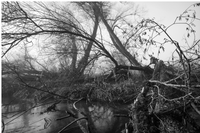
Nebenbach der Aare bei Rubigen