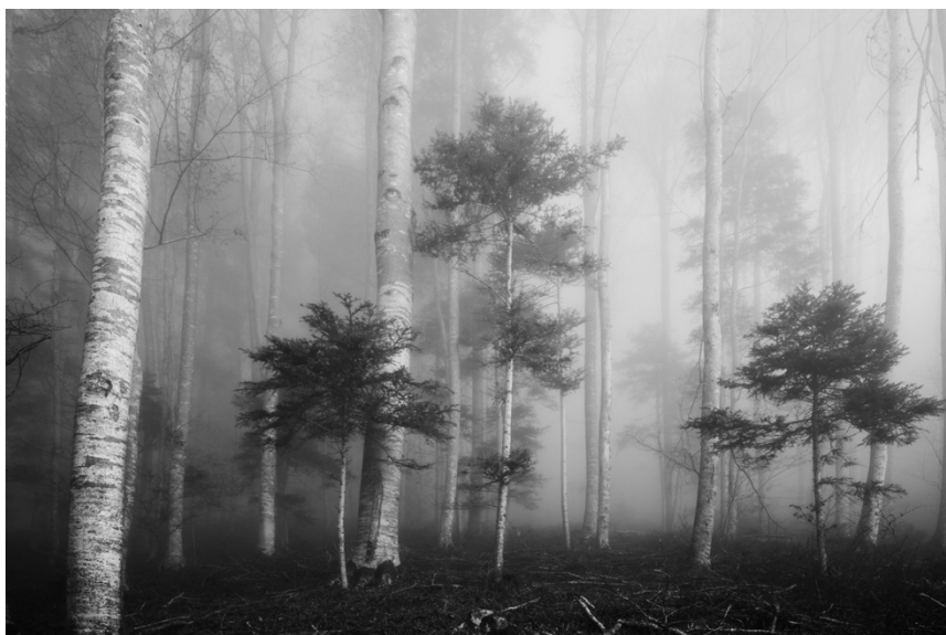
Ganz oben auf dem Belpberg im dichten Nebel.