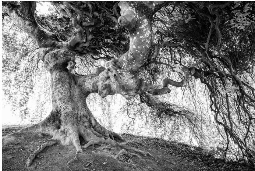
Zehnmal bei den wunderbaren Süntelbuchen in Verzy in der Champagne.