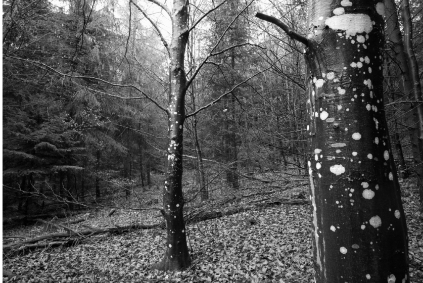
Schwarze Buchen nach dem Regen im Ittigenwald.